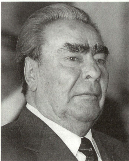
Leonid Breschnew, Generalsekretär der KPdSU von 1964 bis 1982. (Keystone)

Nach den Worten Garejews wurde der Einsatz der Truppen in Afghanistan durch das Fehlen klarer politischer und strategischer Ziele und Konzepte behindert. Wohl gab es Pläne für bestimmte Zeitabschnitte oder für einzelne Operationen. Aber während des gesamten Krieges hatte der Generalstab nie einen strategischen Plan für die Definition der Ziele und Aufgaben der Armee ausgearbeitet. Ziel und Auftrag des Krieges blieben deshalb den Kommandanten unklar. Dies dürfte auch einer der Gründe gewesen sein, warum Struktur und Einsatzkonzeption der