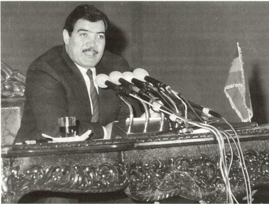
Dr. Mohammad Najibullah (Übername «Der Bulle»), Arzt, Chef des berüchtigten «KHAD» (afghanischer KGB) und prosovjeterischer kommunistischer Staatschef Afghanistans von 1987 bis 1992.

40. Armee nie den Bedürfnissen des Anti-Guerillakrieges angepasst wurden.