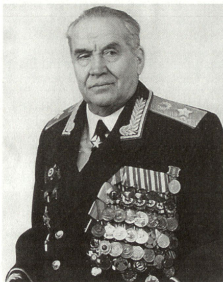
Armeegeneral Mahmut A. Garejew, ehemaliger stellvertretender sowjetischer Generalstabschef und Hauptmilitärberater des afghanischen Präsidenten Najibullah.