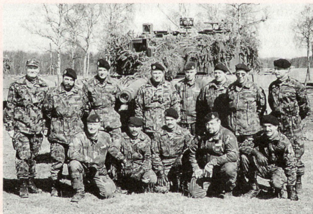
Die schweizerisch-schwedischen Panzerbesetzungen, die an der Panzertruppenübung vom 10. bis 16. April 1996 im Süden Schwedens teilgenommen haben. In der Mitte, mit Feldstecher, der Zugführer Major Peter Dübendorfer, ganz links der Schweizerische Verteidigungsattaché in Schweden, Oberst im Generalstab Georg von Erlach.

Die Schweizer Instruktoren gewannen einen guten Einblick in die Führungsverfahren, die Gefechtstechnik und den Ausbildungsstand der schwedischen Panzertruppe. Die Teilnahme an einer derartigen Übung brachte aber auch viel persönlichen Gewinn für unsere Berufsleute. Der Einsatz im Verband über mehrere Tage bei Tag und bei Nacht in unbekanntem und echtem Panzergelände und mit richtigen Einsatzdistanzen vermittelte wertvolle Erfahrungen. Diese werden im Anschluss an eine sorg-