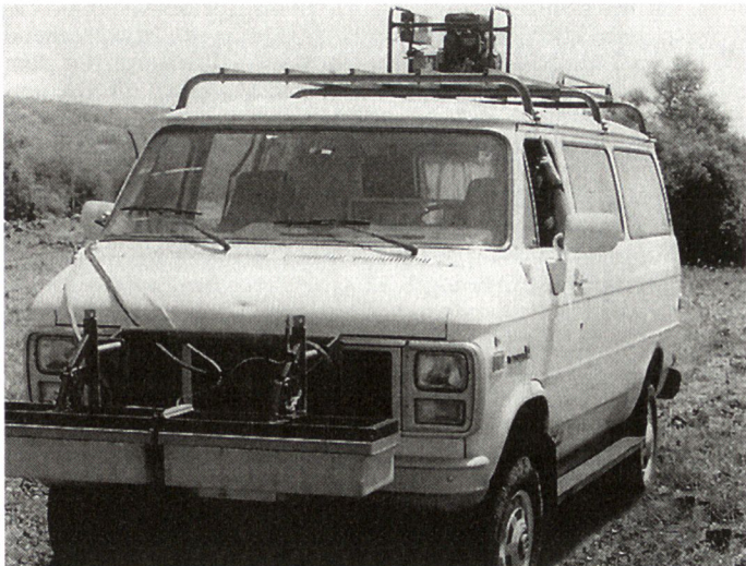
«Bodendurchdringendes Radargerät» GPR zur Minenaufklärung, das an jedem Fahrzeug angebracht werden kann.

nenräumrollen MCRS (Mine Clearing Roller System) für Kampfpanzer, die dem früheren sowjetischen Räumsystem KMT-5 entsprechen. Das System wird in modifizierter Form weiterhin zum Verkauf angeboten.