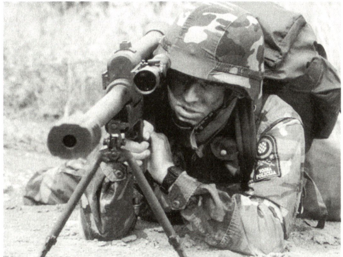
Prototyp eines kroatischen Scharfschützengewehres vom Kaliber 20 mm.

beim südafrikanischen Modell sowie 20x110 mm beim kroatischen Typ, umfassen Sprengbrand- und panzerbrechende Munition, wobei auf kürzere Distanzen eine Durchschlagsleistung von gegen 20 mm Stahl erreicht werden dürfte. Aus naheliegenden Gründen muss bei diesen grosskalibrigen Gewehren der Rückstossminimierung besondere Beachtung geschenkt werden. Die maximale Einsatzdistanz der rund 1,8 m langen Gewehre soll bis zu 1500 m betragen. Vorgesehen ist deren Ausrüstung mit modernen Ziel- und Nachtbeobachtungsgeräten. Die von Kroatien vorgestellte Waffe wiegt ca. 25 kg und kann in zwei Traglasten zerlegt werden. Je nach Einsatzart dürften unterschiedliche Munitionsmagazine zur Verfügung stehen. hg