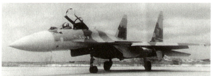
Neuester russischer Jäger Su-37.

Gemäss Insiderinformationen aus Russland soll allerdings der Sicherheitsberater Präsident Jelzins im Zusammenhang mit der Lizenzvergabe an China auf die anstehenden Sicherheitsprobleme hingewiesen haben. Immerhin handelt es sich bei China um einen Staat, der in Zukunft auch als potentieller Gegner Russlands in Frage käme. Zurzeit scheint weiterhin unklar, ob dieses Geschäft (Lizenzproduktion in China) im Umfang von nahezu 1,5 Mia US$ überhaupt zustande kommt. Bt