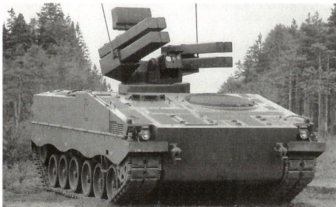
Attrappe des mobilen Flab-Lenkwaffensystems Bosam.