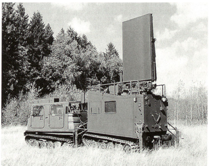
Ab 1997 wird das Artillerieradar ARTHUR an die schwedische Armee ausgeliefert.