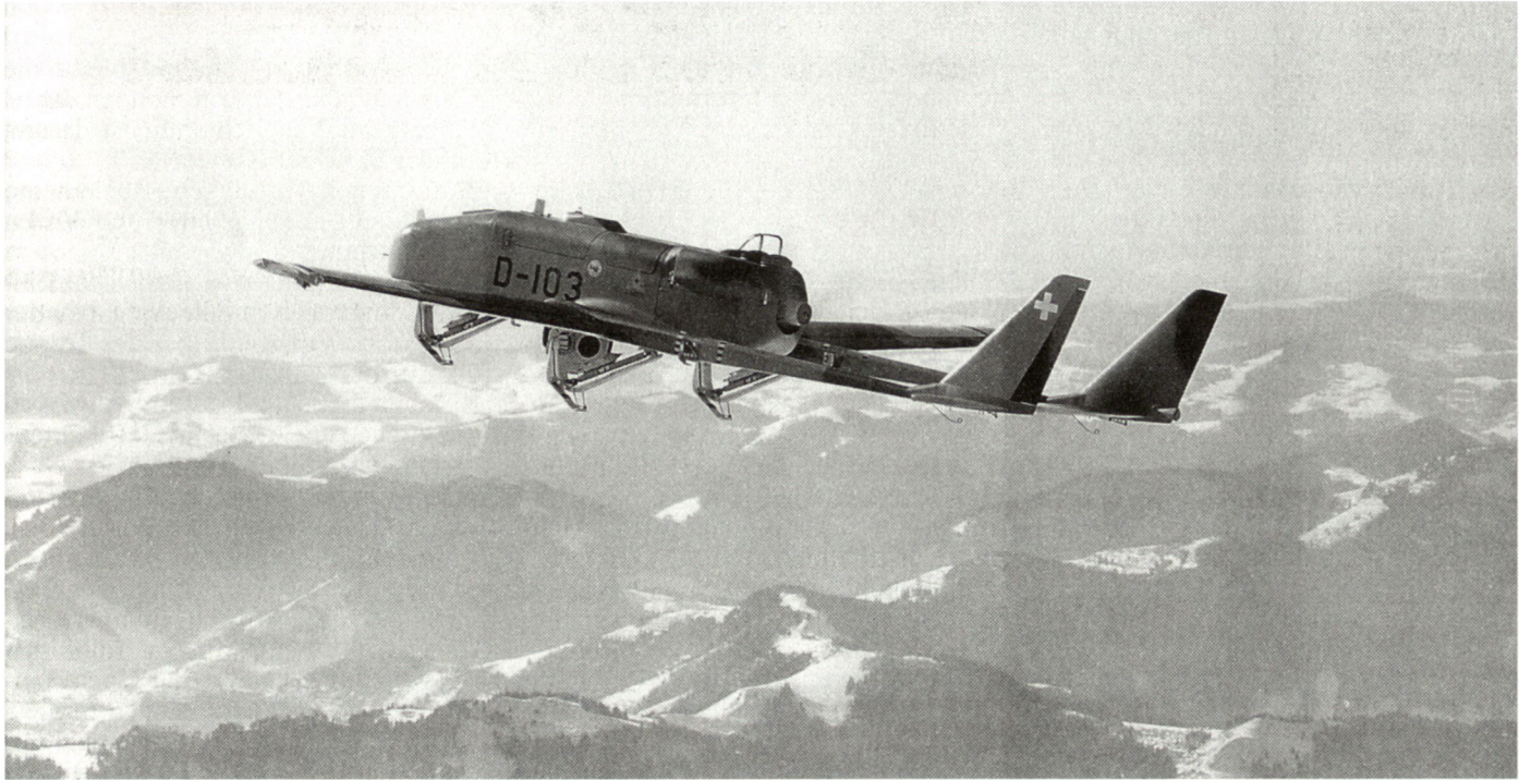
Aufklärungsdrohne ADS-95 Ranger.

Bereitschaft und Teilprofessionalisierung. Die Bedeutung des Armeenachrichtendienstes nimmt dabei weiter zu.