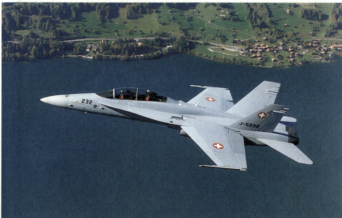
Erstflug F/A-18D «Hornet» über dem Brienzensee (Schweizer Luftwaffe).

Der Programmkostenverlauf ist gut; die im bewilligten Verpflichtungskredit ausgewiesene Risikoreserve ist bisher unangetastet.