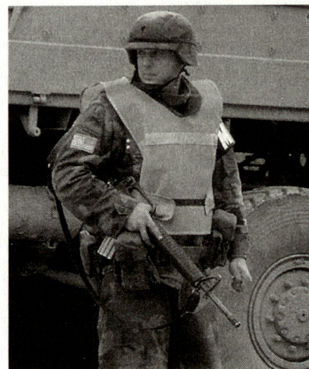
Die USA wird weiterhin die Führungsrolle bei der militärischen Umsetzung des Friedensprozesses in Bosnien-Herzegowina einnehmen. (Bild: Soldat der US Army)