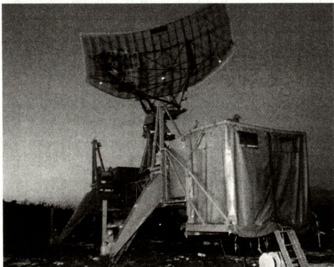
Fransösisches Aladin-Radar im Raume Mostar.

die über bosnisches Gebiet die Städte Sarajewo und Gorazde untereinander verbinden soll.