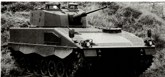
Kampfschützenpanzer Ascod für das österreichische Bundesheer.

Im weiteren sollen aus der eigenen österreichischen Produktion 112 neue Kampfschützenpanzer Ascod sowie eine weitere Serie Radschützenpanzer Pandur beschafft werden. Beide