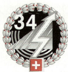
Konzept der TTK in der Informatikbrigade 34.