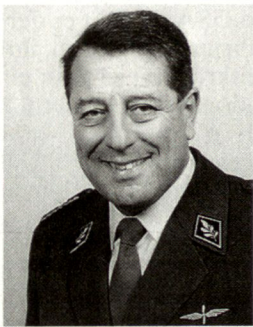
Brigadier Rudolf Läubli, zugeteilter höherer Stabsoffizier des Kommandanten Luftwaffe und Kommandant Stellvertreter der Stabs- und Kommandanten-schulen, Armee-Ausbildungszentrum, 6000 Luzern.

In der Folge werden heute feststellbare Trends in ausgewählten Bereichen der Luftkriegführung festgehalten. Nicht behandelt wird die Boden-Boden-Lenk-waffen-Bedrohung, die nukleare Bedrohung und der weite Bereich der nicht-letalen Waffen.