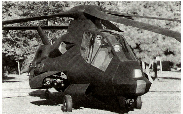
RAH-66 COMANCHE: Kampfhelikopter mit Stealth-Eigenschaften.