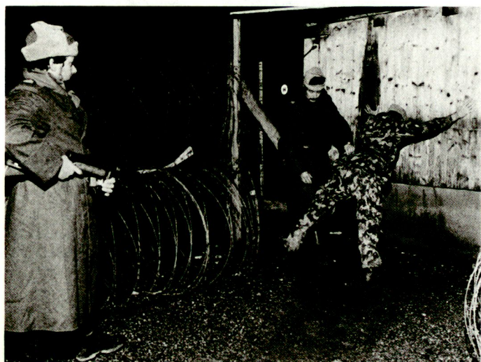
Misstrauen und Sorgfalt schützen vor bösen Überraschungen...