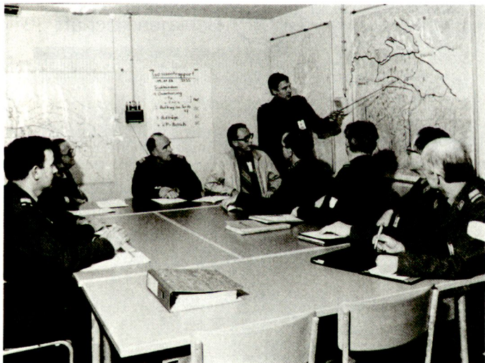
Ter-Kreis und KFS: gemeinsame Verantwortung bedingt gemeinsame Beurteilung...

emporgearbeitet. Aus dem ehemals blauen Zwitter wurde ein feldgrauer Partner mit Waffenstolz und Effizienz. Ob er nun dem Kanton zugewiesen oder in der Hand des Zonenkommandanten eingesetzt wird, das ändert nichts an der Tatsache, dass diese Truppe hinter der Front immer zuvorderst anzutreffen ist. Damit wird sie zur soliden und verlässlichen Stütze realisierter Gesamtverteidigung.