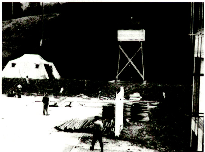
Gefangenen- und Interniertenlager sind auch im Jahre 2000 keine romantische Angelegenheit...