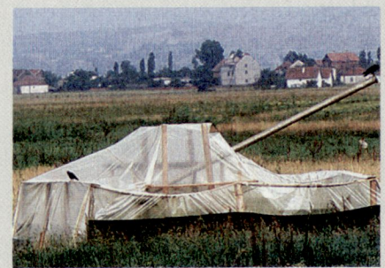
Eine serbische Attrappe, wie sie in den Kampfgebieten im Kosovo häufig zu sehen ist.

Für die Tatsache, dass viele serbische Panzer und Geschütze den 79tägigen Bomben- und Raketen-Krieg überstanden, werden als Gründe das coupierte Gelände und das schlechte Wetter genannt. Auch der Umstand, dass die NATO-Piloten meist aus einer Höhe von 5000 und mehr Metern angriffen, wird als Erklärung angeführt.