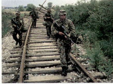
Im britischen Sektor: Eine nepalesische Gurkha-Patrouille auf zerstörten Schienen.