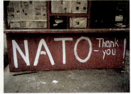
In Suva Reka, 20 Kilometer vor Prizren: Die Kosovaren danken der NATO.