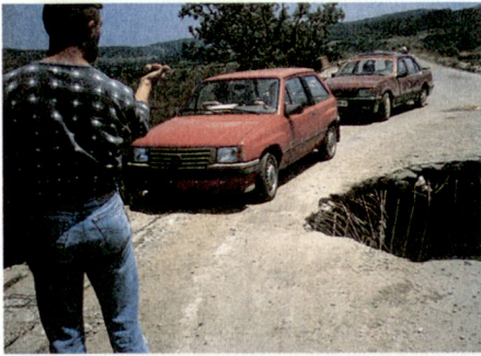
Auf einer Brücke zwischen Pristina und Pec: Umfahren eines NATO-Volltreffers.