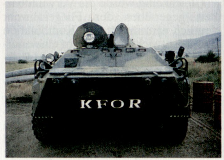
Am 12. Juni besetzten die Russen den Flugplatz von Pristina.