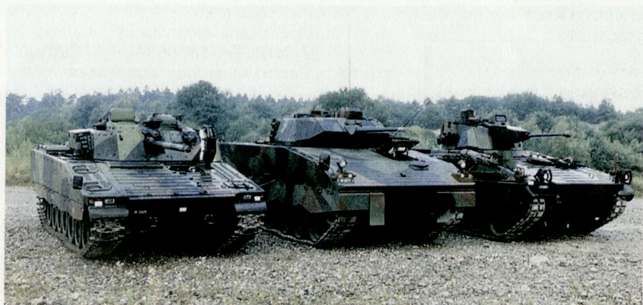
Die drei in der «Schlussrunde» verbleibenden Schützenpanzer: CV 9030 (links), Warrior 2000 (Mitte), KUKA M 12 (rechts).