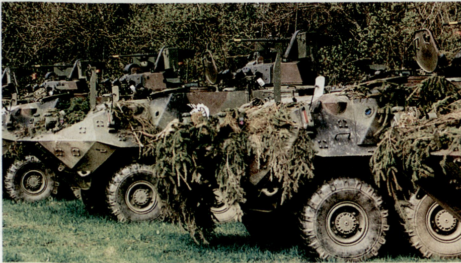
Dritte Tranche Radschützenpanzer Mowag Piranha 8x8 für die Mechanisierte Infanterie.