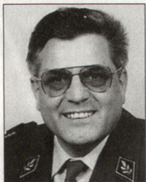
Brigadier Jean-Pierre Cuche