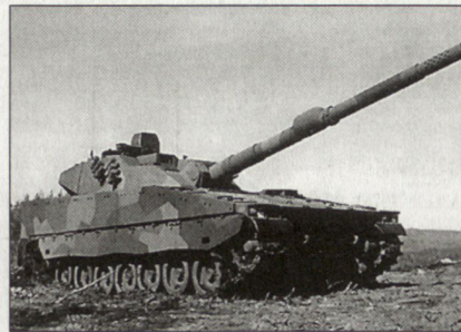
Kampfpanzer CV 90120.