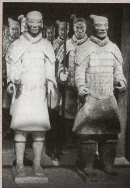
Terrakottaarmee am Grab des ersten chinesischen Kaisers Qin Shihuangdi, 209 v. Chr. (Xi'an, Provinz Shaanxi).

Beeindruckend an dieser Tagung war die Qualität der OR-Studien aus China. Im Vergleich zu vergangenen Jahren haben die chinesischen Wissenschaftler im Bereich des Militärischen Operations Research einen erheblichen Sprung nach vorne erreicht. Ein wichtiges Problem, das in China mit Hilfe des Operations Research gelöst wird, ist die Neustrukturierung der Streitkräfte.