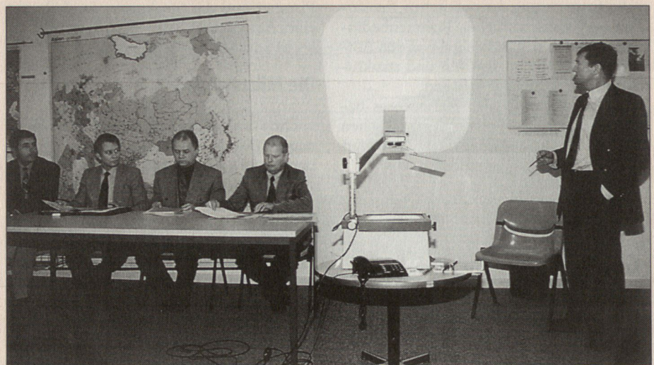
Gelernt ist gelernt. Ein richtiges Arbeits- und Zeitmanagement ist in der Wirtschaft genauso zielführend wie in der Armee.

Sicher schon noch, aber unbewusst. Der Führungs- und Arbeitsstil passt sich aber notgedrungen den jeweiligen Umständen an, und diese sind in der Armee, Verwaltung und der Privatwirtschaft doch sehr unterschiedlich.