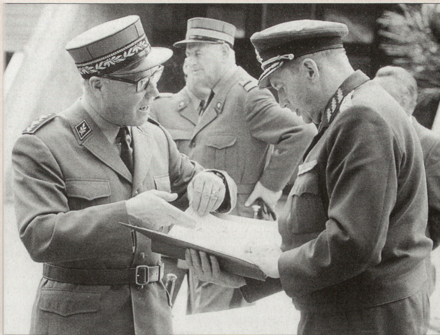
Die Militärs evaluierten den Mirage -III-Jäger Ende der 50-er Jahre.

Die Nuklearbewaffnungsoption hatte aber einige Konsequenzen hinsichtlich der Ausrüstung des Flugzeuges. Für den Bombenabwurfrechner, der für den Nuklearbombenabwurf vorgesehen war, sollten – wie aus einer Studie der Operationssektion hervorgeht – die Raumansprüche abgeklärt und eventuell der nötige Raum verfügbar gehalten werden. Mitten während der Beschaffung wurde dem Generalstabschef beantragt, auf einen Timer in der amerikanischen Taran-Elektronik zu verzichten,