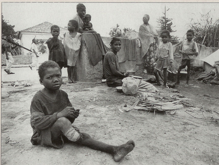
Wie vielen anderen musste auch diesem Kind, Minenopfer, das Bein amputiert werden. ■

Die letzten neun Jahre habe ich tatsächlich an einer einmaligen Schnittstelle zwischen VBS und EDA verbracht. Selbstverständlich stehe ich dem EDA auch in anderer Funktion und anderen Bereichen zur Verfügung.