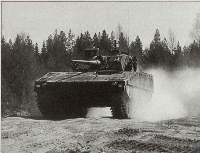
Hohe Mobilität als Voraussetzung zur Zusammenarbeit mit dem Kampfpanzer 87 Leopard 2.

Die Maschinenkanone vom Kaliber 30 mm als Hauptwaffe sowie ein achsparalleles 7,5-mm-Maschinengewehr wird den Besatzungen die Bekämpfung von beweglichen halbhartem und weichen Zielen bis 2000 m und von Luftzielen bis 2500 m ermöglichen. Eine moderne Feuerleitanlage mit Laserentfernungsmesser, stabilisierter Sichtlinie und nachgeführter Hauptwaffe sowie Aufsatz- und Vorhalterechner wird die Feuerkraft des Waffensystems wesentlich erhöhen. Die integrierten optronischen Sichtmittel in Wanne und Turm werden die Zusammenarbeit mit dem Kampfpanzer 87 Leopard 2 bei Nacht und schwierigen Umweltbedingungen ermöglichen. Die modulare Ausführung des