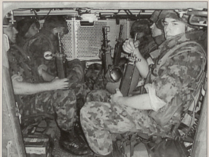
Acht vollausgerüstete Panzergrenadiere können mitgeführt werden.