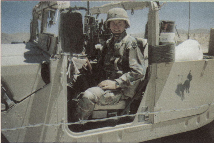
Chapl. Byron J. Simmons, US-Army, im Einsatz irgendwo in der Golfregion.

dies ist typisch für die meisten militärischen Standorte. Menschen, die in die Armee eintreten, sind oft sehr patriotisch, und patriotische Menschen tendieren dazu, gläubig zu sein.