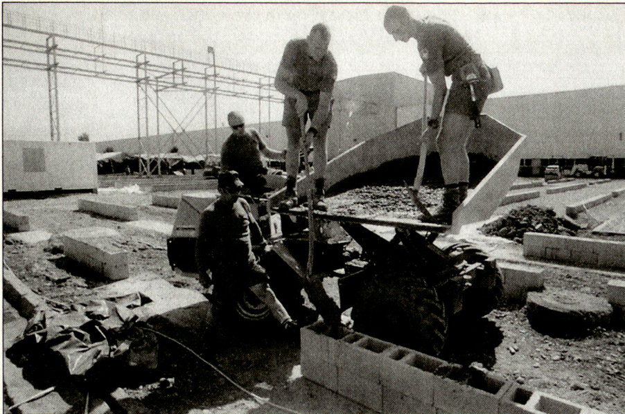
Baufachleute des Festungswachtkorps und andere Armeeeingehörige betonieren die Fundamente für das SWISSCOY-Camp.

dafür notwendigen Eigenständigkeit gefestigt. Diese Art der Kooperation muss vermehrt in den strategischen Zielformulierungen der KMU erscheinen.