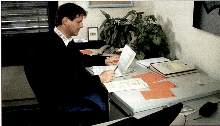
Das Assessment hat sich in der Privatwirtschaft als Instrument zur Potenzialbeurteilung bewährt.

folgenden, nach Prioritäten geordneten Kriterien, die als erfolgsrelevant für die Arbeit des GSt Of erachtet wurden: