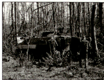
Zerstörter jugoslawischer Schützenpanzer.

Das nächste gemeldete Objekt war ein abgeschossener jugoslawischer Schützenpanzer. Dieser sollte durch deutsche AC-Spezialisten auf DU-Munitionsspuren (abgereichertes Uran) untersucht werden. Zunächst musste aber der Weg zum Wrack vom AUCON-Team auf Minen abgesucht werden. Zwei Stunden später erschienen zwei deutsche Schützen-