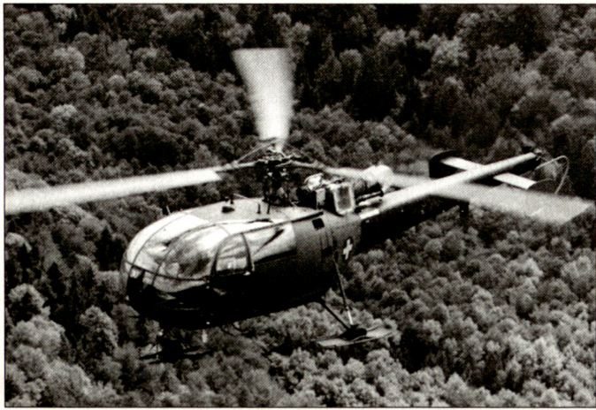
Mit dem Kauf von 84 Alouette-III-Helikoptern begann sich der Lufttransport zum eigenständigen Teil der Flugwaffe zu entwickeln.

heute noch die Grundlage der Übertrittsregelungen vom UeG zur Swissair. Im gleichen Jahr schulten die UeG-Staffeln 1 und 11 auf den eleganten und leistungsstarken Hunter um.