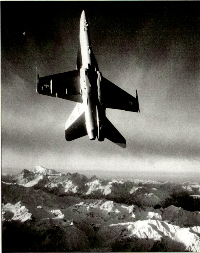
Seit 1997 ist die moderne F/A-18C/D Hornet die Speerspitze der schweizerischen Luftverteidigung.

Eine Reformflut prägte die Zeit nach dem Ende des Kalten Krieges. Auch das UeG wurde von diesem stürmischen Wandel nicht verschont. Hektische Unrast, Vervielfachung der Aufgaben, die Öffnung nach aussen und eine zunehmend angespannte Personalsituation bestimmen den Alltag. Zwischenstaatliche Abkommen erlauben seither der Luftwaffe die Zusammenarbeit mit anderen Luftwaffen.