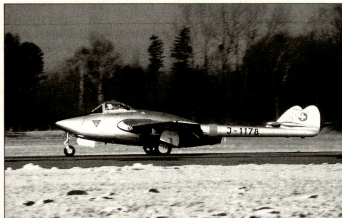
Mit der Beschaffung der De Havilland DH-100 Vampire in England wurde die Fliegertruppe vom Kolbenmotor ins Jet-Zeitalter geführt.