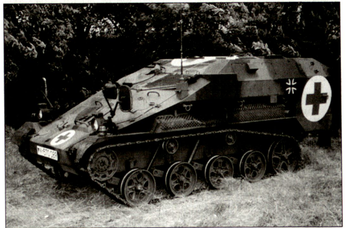
Prototyp des Sanitätsfahrzeuges «Wiesel 2».

Zur künftigen Sicherstellung der sanitätsdienstlichen Versorgung des KFOR-Verbandes in Kosovo muss daher die Nachbeschaffung eines geschützten Sanitätsfahrzeuges unverzüglich durchgeführt werden. Aus diesem Grunde soll die Sanitätsvariante des «Wiesel 2», die ausreichend gegen Blastminen geschützt ist, beschafft werden. Unmittelbar vorgesehen ist die Zuführung von zehn Fahrzeugen; sechs für die Einsatzkompanien, zwei für die mobilen Arzttruppen