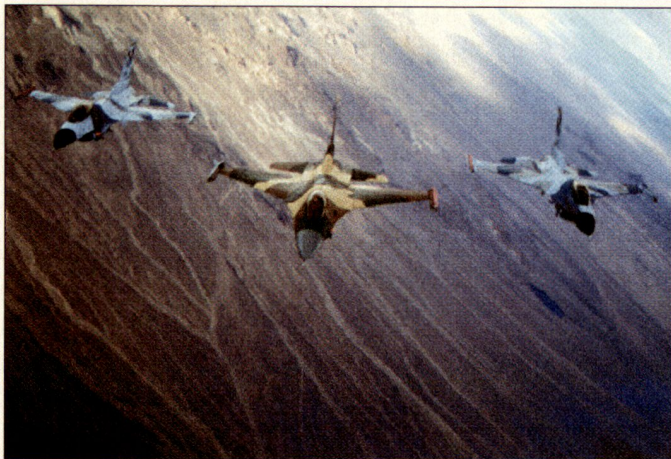
F-16 Fighting Falcon «AGGRESSOR's» über Nevada.

Die Übung wird unter sehr strengen Sicherheitsmassnahmen durchgeführt. Sie beginnt mit einem ganztägigen Einführungsrapport, an dem sämtliche Sicherheitsvorschriften erklärt und besprochen werden. Die Piloten sind angewiesen, unsichere Situationen sofort zu melden. Trifft dies ein, wird die Übung sofort unterbrochen, und die Ursachen werden analysiert.