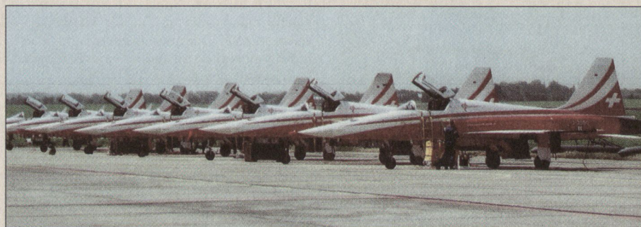
Die Patrouille Suisse mit F-5E Tiger II auf der Flight-Line.