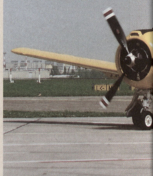
North American T-28