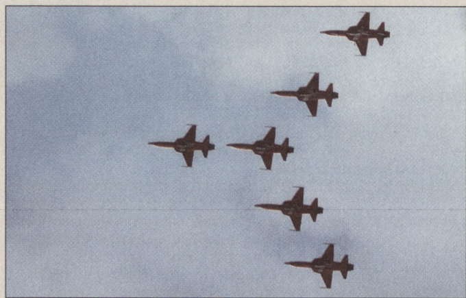
Die Patrouille Suisse in der Formation «Schwan».

Der wirkliche Star der ILA war aber das Kampfflugzeug Eurofighter/Typhoon. Mit diesem Flugzeug haben die Europäer nicht nur ihre Fähigkeit zur Entwicklung moderner Technologie bewiesen, sondern auch eine überragende Konkurrenz gegenüber F/A-18E/F von Boeing und Gripen von Saab geliefert. Die Leistungen