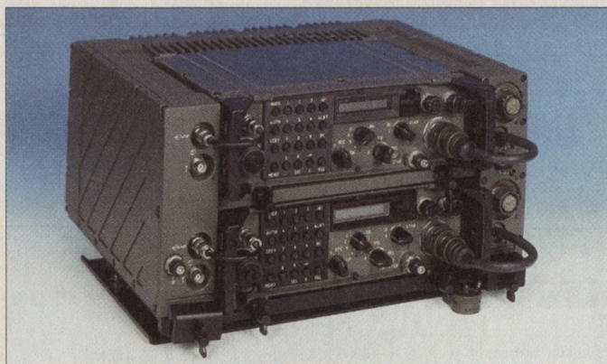
Taktisches Funkgerät SE-235.

Der Bundesrat unterbreitet in einer Zusatzbotschaft zum Rüstungsprogramm 2002 den Räten 37 Millionen für Ausbil-dungsmittel zum neuen Schützenpanzer 2000. Im kommenden Herbst werden die ersten der mit dem Rüstungsprogramm 2000 bewilligten 186 Schützenpanzer des schwedischen Typs CV 9030 ausgeliefert. Zu Ausbildungszwecken müssen noch drei Chassis- und sieben Turmtrainer beschafft werden. Die beantragte Investition von 37 Millionen wird gleichzeitig im Rüstungs-programm 2000 gekürzt und erhöht den Verpflichtungskredit insgesamt nicht. ■