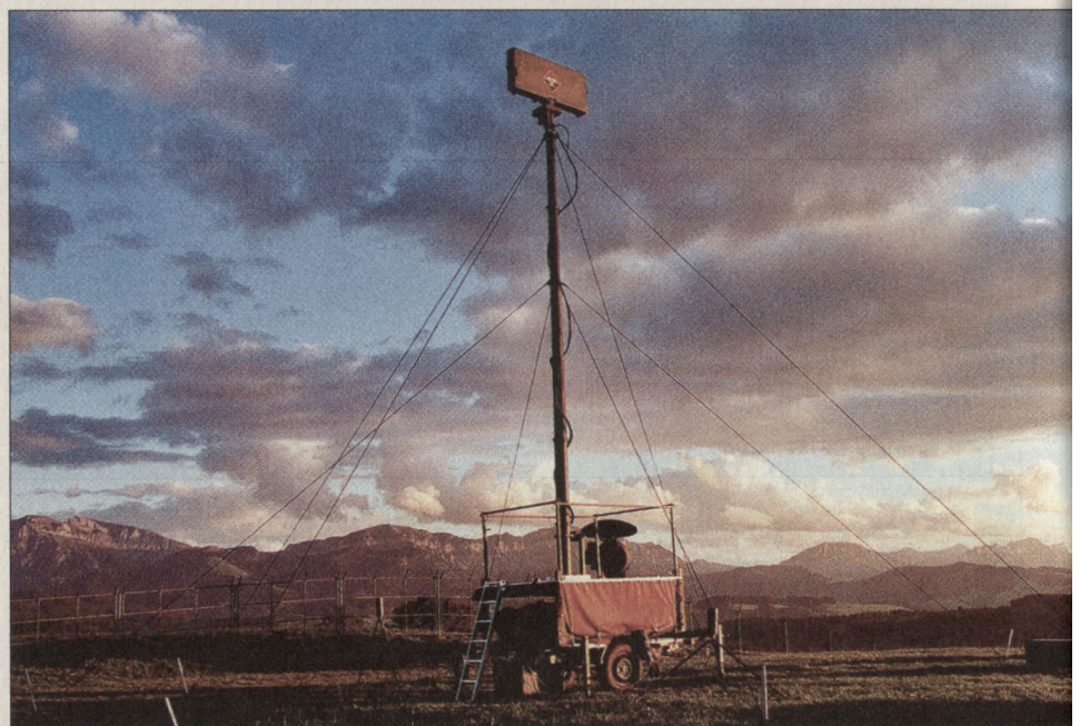
Alarmierungssystem Stinger mit Mast.

Im Jahre 2001 betrug der Gesamtwert des exportierten Kriegsmaterials 258,2 Millionen Franken (2000: 213,6 Mio.). Dies entspricht einem Anteil von 0,19% (2000: 0,16%) der gesamten Warenausfuhr der Schweizer Wirtschaft. Die hauptsächlichsten Abnehmerländer waren Deutschland (46,9 Mio.), Irland (38 Mio.), Spanien (30,4 Mio.), die USA (21,7 Mio.) und Grossbritannien (14,7 Mio.). www.seco-admin.ch dk