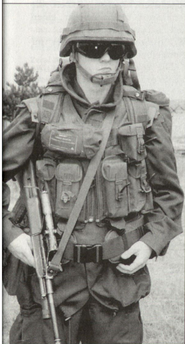
Evaluation einer neuen Kampfbekleidung für österreichische Soldaten.

Unterdessen wird der neue Kampfanzug auch durch österreichische Truppen im internationalen Einsatz (KFOR, ISAF) getestet. Dabei geht es darum, die gemachten Erfahrungen und Ergebnisse der Erprobung zu bewerten und gegebenenfalls durch Weiterentwicklungen bzw. Veränderungen und Verbesserungen umzusetzen. Nach einer definitiven Entscheidung soll ab 2003 die neue Kampfbekleidung an die Truppe abgegeben werden. hg