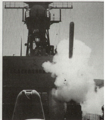
Abschuss eines Marschflugkörper «Tomahawk» ab einem US-Kampfschiff.

Die verwendeten Gefechtskopffarten variieren: Nebst Einzelgefechtsköpfen von 450 resp. 318 kg Gewicht existieren auch Kanistergefechtsköpfe mit Bomblets