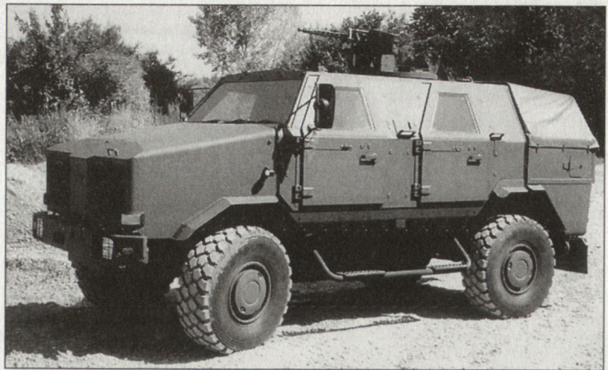
Das neue Allschutz-Transportfahrzeug (ATF) «Dingo» steht heute auf dem Balkan und in Afghanistan im Einsatz.

Was für den Kampfpanzer «Leopard 2» bisher ein Wunsch blieb, wird jetzt für das Allschutz-Transportfahrzeug Dingo realisiert: Die ersten Fahrzeuge werden mit einem Führungs-Informa-