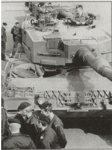
Ausbildung polnischer Panzersoldaten am Kampfpanzer «Leopard 2A4.

Corps) im alliierten Kommandobereich Europa befindet sich in Düsseldorf. Insgesamt wird die Bundeswehr nebst anderem Mate-