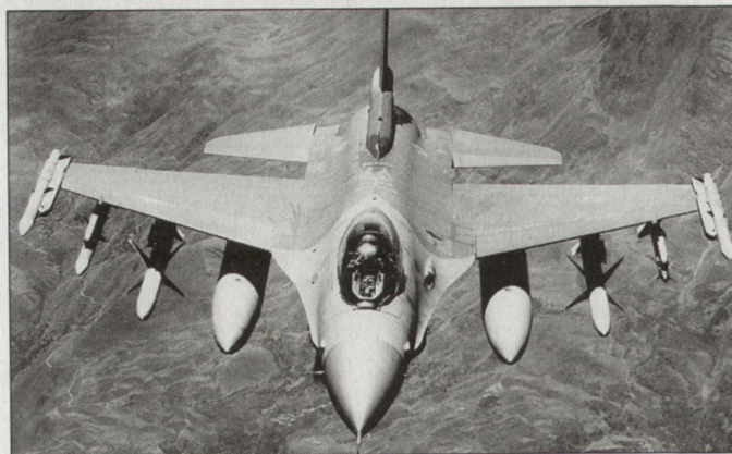
US-Luftstreitkräfte in der Golfregion (Bild Kampfflugzeug F-16) werden künftig vermehrt vom Stützpunkt El Udeid (Qatar) aus operieren.

Die Ausbildung erfahren die polnischen Panzerbesetzungen beim deutschen Panzerbataillon 64 in Wolfhagen. Die 10. polnische Brigade ist ab Herbst 2002 in den Übungszyklus der deutschen 7. Division einbezogen. Bereits im vergangenen November hat im Rahmen einer ARRC-Übung ein erster Einsatztest stattgefunden. hg