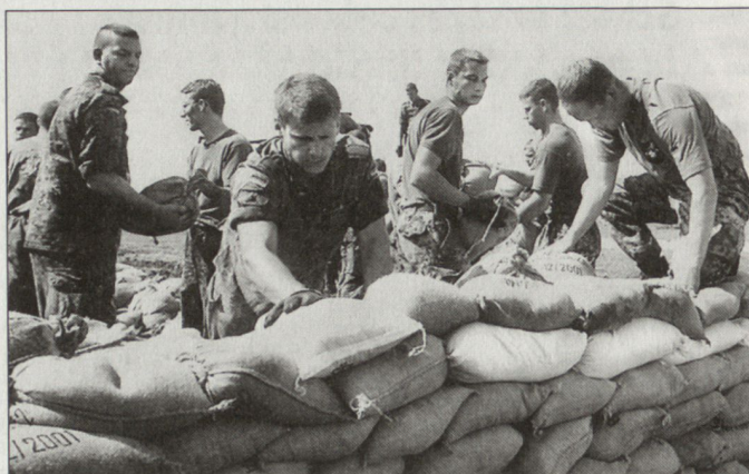
Bisher grösster Katastropheneinsatz in der Geschichte der deutschen Bundeswehr.

Dieser Einsatz der Bundeswehr war der grösste Katastropheneinsatz in ihrer Geschichte. Selbst im Vergleich zum Oder-Einsatz vor fünf Jahren stellte der diesjährige Einsatz an der Elbe eine neue