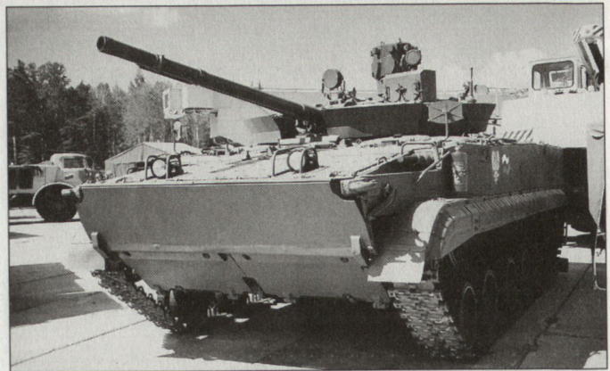
Schutzsystem «Arena 2» auf einem Kampfschützenpanzer BMP-3; erkennbar sind der Kassettenkragen am Turm und die Sensorik zuoberst in der Turmmitte.

nen vorgenommenen Verbesserungen ist nicht bekannt. Jedoch ist davon auszugehen, dass die Wirksamkeit des Systems gesteigert wurde – z. B. durch Optimierung der Splitterkassette und der Ausstossladung, durch Einsatz eines leistungsfähigeren Rechners