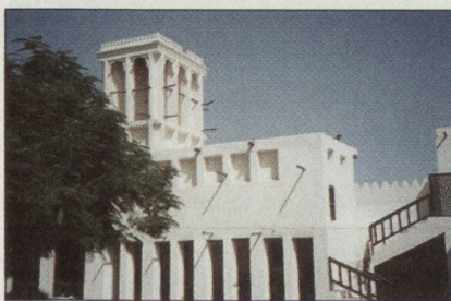
Abbildung 3: Fort von Ras al-Khaima.