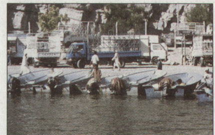
Abbildung 7: Der Hafen von Khasab.

Dieser Schmuggel ist umso erstaunlicher, als das Sultanat Oman als Alliiertes der USA und Grossbritanniens gilt und die Emirate offiziell eine prowestliche Politik verfolgen. An diesem Beispiel wird die reale Politik im Persischen Golf sichtbar. Die Beziehungen zwischen den verschiedenen Staaten entsprechen nicht der Sichtweise westlicher Vorstellungen von Politik und Strategie.