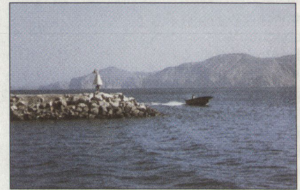
Abbildung 6: Schmugglerboot.

Sehr früh am Morgen brausen kleine Motorboote in den Hafen von Khasab (Abbildung 6). Es sind iranische Schmugglerboote, die unter Umgehung des US-Boykotts verschiedene Güter wie Geflügel usw. in den Hafen bringen. Im Hafen werden die Güter sofort in bereitstehende Lastwagen (Abbildung 7) umgeladen, die ihre Fracht über den schlecht kontrollierten Grenzposten von Tiba nach Dubai bringen, wo sie mit Schiffen oder Flugzeugen weitertransportiert wird.