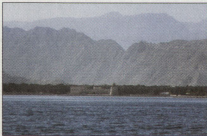
Abbildung 2: Khasab.

Ein grosser Teil des Erdöls aus den Staaten des Persischen Golfs wird nach Japan und Europa durch Tanker transportiert, die zu diesem Zweck die 50 km breite Strasse von Hormuz durchqueren müssen. Im Norden wird die Strasse durch verschiedene Inseln begrenzt, die iranisches Territorium sind. Der südliche Teil bildet die Halbinsel Musandam, die zum Sultanat Oman gehört. Musandam ist eine Enklave, die durch das Gebiet der Vereinigten Arabischen Emirate (UAE) vom eigentlichen Oman abgetrennt