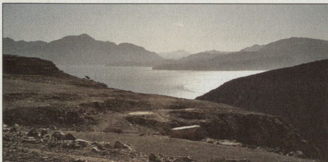
Abbildung 4: Landschaftliche Schönheiten.

ist. Musandam ist auch der Beobachtungsposten der Omani und damit der Briten und der Amerikaner zur Überwachung des Schiffsverkehrs in der Meerenge.