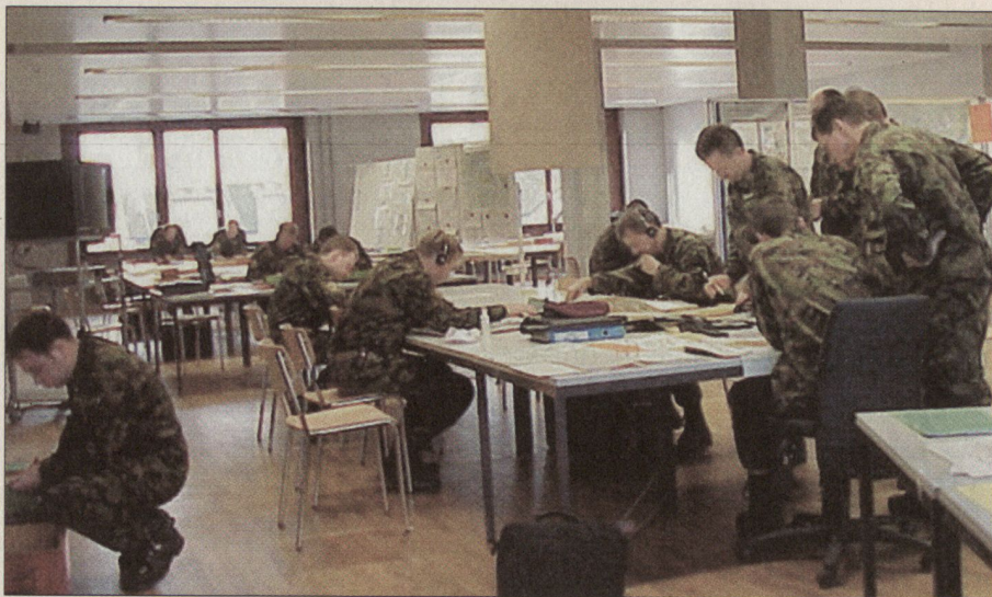
Der Führungssimulator 95 ist von der Ausbildung unserer Stäbe Stufe Bataillon bis Brigade nicht mehr wegzudenken.

■ Ausbau der Übungsinfrastruktur für mehr Direktunterstelle (modularer Brigadetyt XXI),