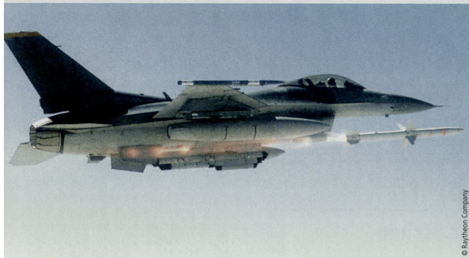
F-16 schießt AGM-88, HARM, ab.