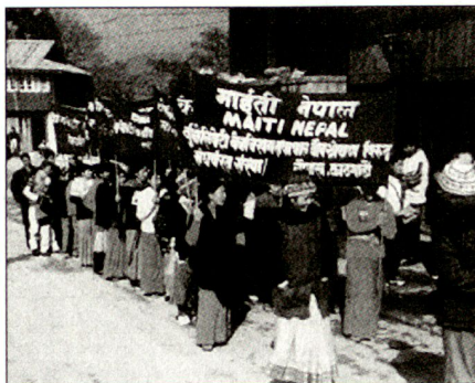
Informations- und Aufklärungskampagne von Maiti Nepal.

Maiti Nepal ist eine nepalesische NGO (Non Governmental Organisation) mit Sitz in Kathmandu, die sich die Bekämpfung von Menschenhandel, Verschleppung und Kinderprostitution zur Aufgabe gemacht hat. Maiti ist Nepali und bedeutet «Haus der Mutter». Die Organisation wurde 1993 von Anuradha Koirala gegründet. Maiti Nepal hilft verzweifelten Kindern und jungen