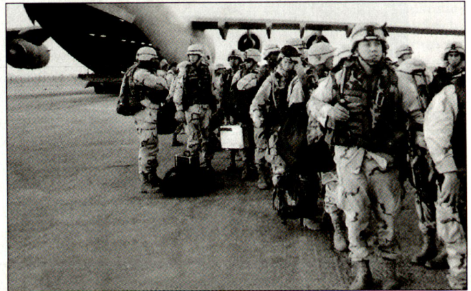
Unter den in die Golfregion verlegten US-Truppenteilen befinden sich auch Einheiten aus Deutschland.

Truppen in Europa dürfte auch stark davon abhängen, wie lange der laufende Golfkrieg dauert, wie hoch sich die diesbezüglichen Kosten belaufen werden und welche Truppenpräsenz über die nächsten Monate und Jahre im Irak belassen werden müssen. Bekanntlich stehen auch amerikanische Kräfte aus Deutschland im laufenden Golfkrieg im Einsatz. Dazu gehören insbesondere Truppen des Kommandos des V. US-Korps in Europa. Kurzfristig dürften sich aber, trotz Kritik amerikanischer Politiker, keine wesentlichen Dislozierungsveränderungen bei den US-Truppen in Europa ergeben. hg