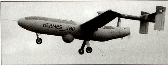
Israelische Aufklärungsdrohne «Hermes 180».

war bisher daran, für die Streitkräfte eigene Infanteriewaffen zu entwickeln. Diese Beschaffung eines ausländischen Produktes lässt aber den Schluss zu, dass bei den auf russischen Sturmgewehren basierenden Eigenentwicklungen Probleme aufgetaucht sind. Erste Serien der indischen Eigenentwicklung «Insas» von Kaliber 5,56 mm wurden bereits in den 90er-Jahren der Truppe zugeführt. Indien ist