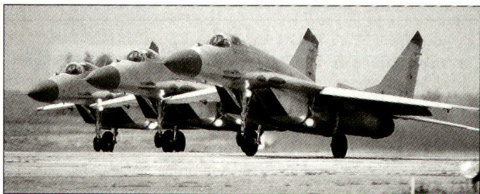
Neues russisches Angebot für Kampfflugzeuge MiG-29M.

Bundeskanzler Schüssel hat unterdessen bekannt gegeben, dass am Entscheid zum Kauf des Eurofighter «Typhoon» festgehalten werde. Weiterhin unklar ist aber deren Finanzierung. Die noch im letzten Jahr angeregte Idee, den Ankauf der Abfangjäger von einer Wirtschaftsplattform finanzieren zu lassen, konnte bisher nicht verwirklicht werden. Auch eine Erhöhung des Verteidigungsbudgets lässt sich gegenwärtig in Österreich aus politischen Gründen kaum verwirklichen. hg