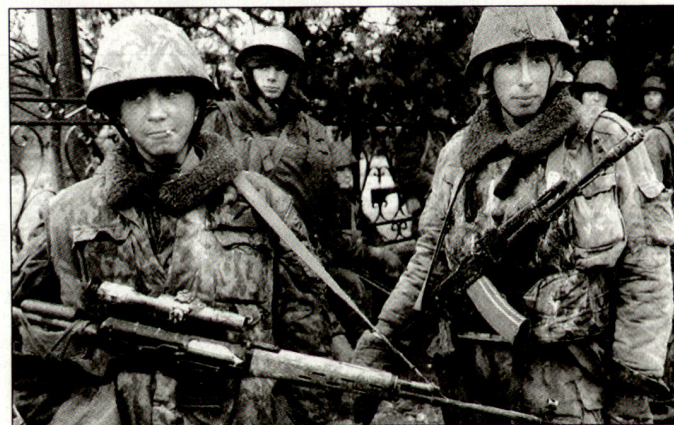
Russische Truppen sind seit 1999 an NATO-Friedensmissionen auf dem Balkan beteiligt.

sche KFOR-Kontingent um rund 600 Mann reduziert worden. Gegenwärtig sind die russischen KFOR-Truppen mit ihrem HQ auf dem Flugplatz Slatina bei Pristina sowie mit Teilen in der Region von Kosovska Kamenica in der durch die USA geführten Brigade Ost stationiert. Mit dem Abzug dieser Truppen können gemäss Angaben Russlands dringende erforderliche Einsparungen vorgenommen werden; die jährlichen Kosten von umgerechnet rund 45 Mio. SFr. sollen für andere dringende militärische Zwecke genutzt werden. hg