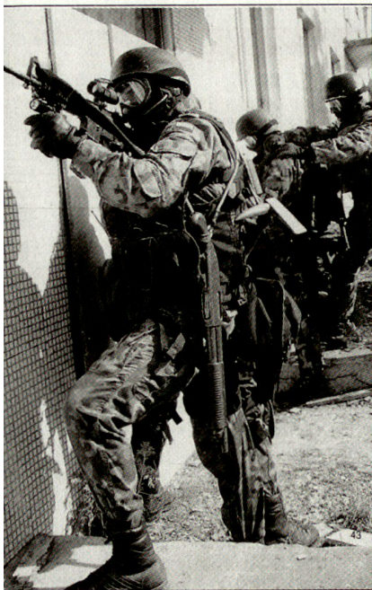
Angehörige der polnischen Elitetruppe GROM bei der Ausbildung.

Nebst dem Kontingent Elitetruppe hatten die polnischen Streitkräfte auch Marinesoldaten, ein Versorgungsschiff und Angehörige der ABC-Abwehrinheit den Koalitionstreitkräften zur Verfügung gestellt. hg