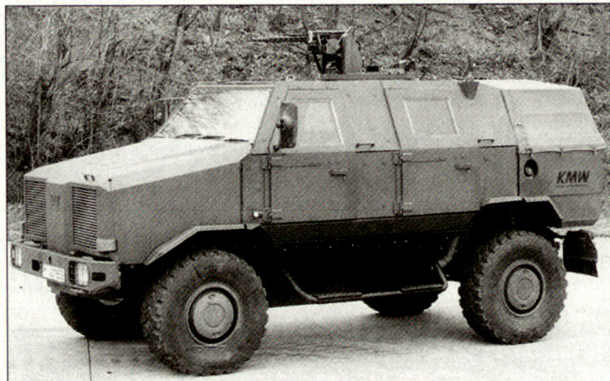
Allschutzfahrzeug «Dingo 2».

barung zur Zusammenarbeit bei der Produktion des Transportfahrzeugs «Dingo 2» abgeschlossen. Als Allschutzfahrzeug, das sich vor allem für militärische Einsätze in Krisenregionen eignet, schützt der neue «Dingo 2» vor dem Beschuss durch Infanteriewaffen und panzerbrechende Kleinwaffen sowie