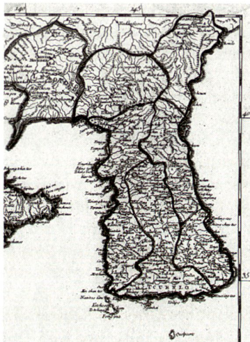
Korea um 1750* 1