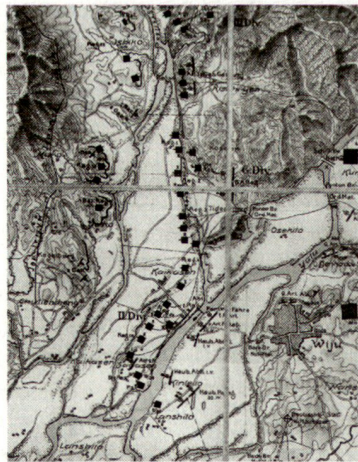
Plan der Schlacht am Yalu, 29. April bis 1. Mai 1904 *6