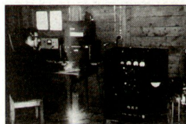
Funkstation in der Kaserne Bülach, 1964 *58