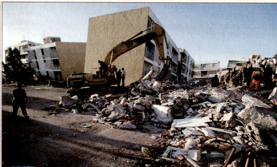
Für den schweren Rettungseinsatz sind Geräte und Maschinen unerlässlich.

den Rettern gleichzeitig ganz wichtige Hinweise für die Such- und Rettungsarbeiten.