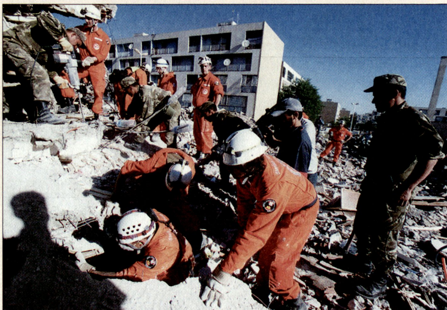
Einsatz der Retter – Seite an Seite.

Das Schweizer Team hatte ein ausgezeichnetes Einvernehmen mit den Spezialisten des algerischen Zivilschutzes. Auch auf einem Schadenplatz in Boumerdès, dem Haupteinsatzraum der Schweiz, habe ich persönlich ein ausserordentlich positives Beispiel einer effizienten und gleichzeitig freundschaftlichen Zusammenarbeit erlebt. Dort arbeiteten HundeführerInnen, Retter, Mitglieder des lokalen Zivilschutzes und betroffene Bewohner auf engstem Raum Seite an Seite. Gezielt wurde sogar der Vater einer jungen Familie in die Rettungsarbeiten einbezogen. Er grub und suchte nicht nur mit teilweise blossen Händen nach seinen Angehörigen, er gab