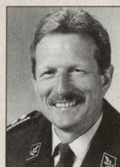
Ulrich Zwygart, Divisionär, Kommandant Höhere Kaderausbildung der Armee, AAL, 6000 Luzern 30.

Die Herbsttagung der Zentralschule ist dem Thema Miliz gewidmet. Im Spätherbst findet zudem das «Symposium pour les officiers de la Romandie et du Tessin» am Genfersee statt. Beide Veranstaltungen bilden eine Begegnungsmöglichkeit für militärische und zivile Verantwortungs-träger. ■