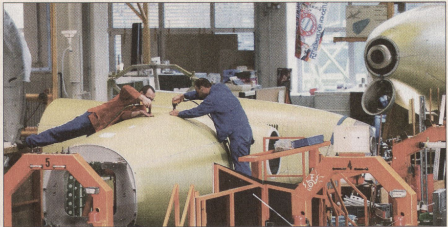
Ein Beispiel aus dem Strukturbau für die Airbus-Zivilflugzeuge (Standort Oberpfaffenhofen).

Der Zivildanteil beträgt heute 33%. Dazu gehören Produkte für die Luft- und Raumfahrt, so liefern wir Strukturbauteile für die Airbusflugzeuge oder Nutzlastver-