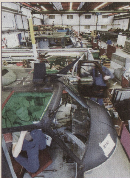
Am Standort Oberpfaffenhofen (D) wird die Bell UH-1-D Hubschrauberflotte im Auftrage des deutschen Bundesministeriums für Verteidigung umfassend modernisiert.

Die Schnittstelle zwischen der Industrie und den Betrieben der Logistikbasis wird momentan überprüft. Wir sind offen für betriebswirtschaftlich gute Lösungen im Gesamtinteresse der Armee. ■