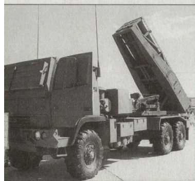
Leichter Raketenwerfer HIMARS der US Army.

Im Frühling 2003 sind erste Waffensysteme HIMARS u. a. auch im Irakkrieg eingesetzt worden. Sie sind als Unterstützungswaffen für die künftigen leichten Brigaden vorgesehen. Die aktuelle US-Streitkräfteplanung sieht die Beschaffung von insgesamt 900 Waffensystemen HIMARS vor. Im Gegensatz zum Mehrfachraketenwerfer MLRS auf Kettenfahrzeuggestell kann der HIMARS mit herkömmlichen Transportflugzeugen verlegt werden. Zudem kann auch mit dem HIMARS die gesamte MLRS-Munitionsfamilie einschliesslich des Army Tactical Missile System (ATACMS) und der neu entwickelten Lenkraketen (GMLRS) verschossen werden. Die ersten Waffensysteme HIMARS aus der Serienproduktion sollen im Jahre 2005 der US Army zulaufen. hg