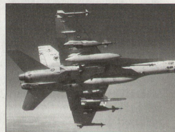
F/A-18 der spanischen Luftwaffe.

Im Januar 2004 hat die spanische Luftwaffe mit der Kampfwertsteigerung ihrer Kampfflugzeuge F/A-18 begonnen. Im Verlaufe der nächsten vier Jahre sollen insgesamt 65 F/A-18 bei den spanischen Flugzeugwerken CASA/EADS modernisiert und auf den neusten Stand gebracht werden. Geplant ist, dass monatlich eine Maschine den Werken in Getafe zugeführt wird; die ersten der kampfwertgesteigerten Flugzeuge sollen gegen Ende 2004 an die Luftwaffe zurückgehen. Die Gesamtkosten der Kampfwertsteigerung betragen gemäss Planung rund 190 Mio. Euro. Das Modernisierungspaket umfasst im Wesentlichen neue Software für Avionik, Navigation und Kommunikation, die beim CLAEX (Centro Logistico de Armamento y Experimentación) der spanischen Luftwaffe entwickelt worden ist. Die neue Technologie erfordert auch entsprechende Anpassungen bei