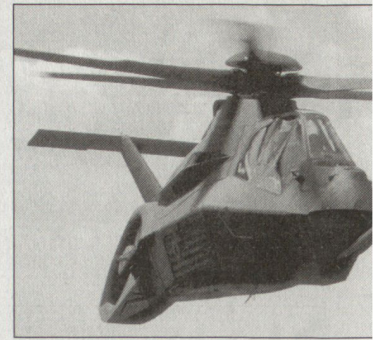
Das aufwändige Entwicklungsprogramm des Kampfhelikopters «Comanche» wurde gestoppt.

■ Entwicklung weiterer unbemannter Luftfahrzeuge, die insbesondere über grössere Reichweiten und eine erhöhte Einsatzdauer verfügen; dafür werden in den