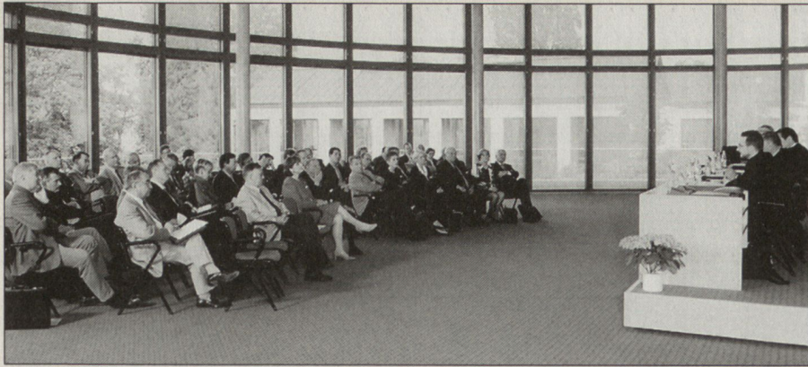
Die Veranstaltung zum Thema «Nation-Building» fand im neuen Zentrum des Lilienberg Unternehmerforums in Ermatingen/TG statt.

1990er-Jahre doch vorangekommen; in den Kampfjahren sei die Feindseligkeit zwischen den ethnischen Gruppierungen noch stärker gewesen als heute.