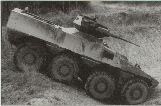
Prototyp des französischen VCI-Programms; die Serienproduktion des neuen Schützenpanzers soll 2009 beginnen.

schwindigkeit von 105 km/h erreicht werden. Der Fahrbereich beträgt dabei rund 750 km.