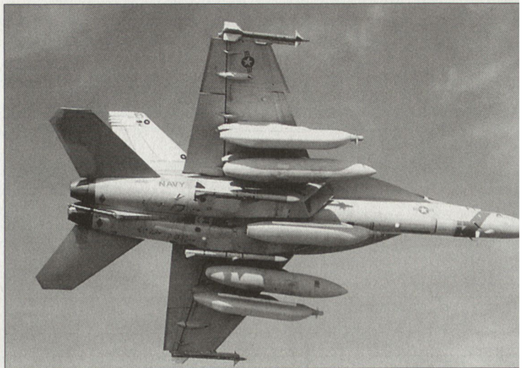
Erprobungsträger des neuen Kampfflugzeuges EA-18G «Growler».

Für Boeing garantieren diese Verträge über die nächsten fünf Jahre, einerseits von jährlich je 42 Maschinen «Super Hornet» und andererseits durch die Entwick-