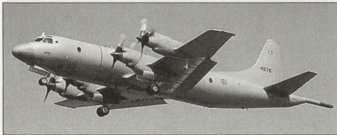
Die veralteten Aufklärungsflugzeuge P-3 «Orion» der US-Navy sollen in den nächsten 10 bis 15 Jahren abgelöst werden.

Vorerst plant die Firma Boeing den Bau eines Demonstrationsmodells, das im Jahre 2007 zur Verfügung stehen soll. Anschliessend sollen vier weitere Vorserienflugzeuge für Testzwecke gebaut werden. Mit den neuen hochmodernen bemannten Aufklärungsflugzeugen sollen die veralteten Maschinen vom Typ P-3 «Orion» abgelöst werden. Diese wurden ab dem Jahre 1962 in Dienst gestellt und sind in der Zwischenzeit mehrmals modernisiert worden. Mit dem modernen Nachfolgemodell soll künftig ein weltweit rascherer Aufklärungseinsatz mit kleineren Bedienungsteams und wesentlich geringerer logistischer Unterstützung zu Gunsten der Navy erreicht werden. hg