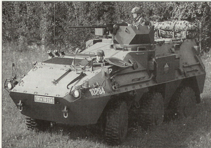
Österreichischer Schützenpanzer «Pandur» in den slowenischen Streitkräften.

Die EUFOR unterstützt weiterhin die zivilen Behörden in Bosnien. Im MSU-Bataillon sind nebst slowenischen und österreichischen Soldaten auch italienische Carabinieri sowie ungarische und rumänische Soldaten und Polizisten vertreten. Die Kooperation mit Slowenien ist ein Ergebnis der Zusammenarbeit innerhalb der mitteleuropäischen Militärinitiative CENCOOP (Central Europe-