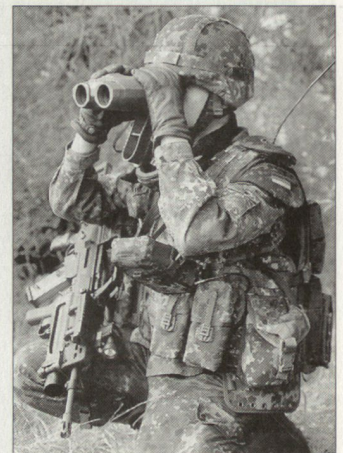
Versuche mit ersten Komponenten für den «Infanteristen der Zukunft» bei der deutschen Bundeswehr.

Die ersten Kontingente der Bundeswehr für die NRF sollen ab Januar 2005 einsatzbereit sein. Bis 2008 sollen die Division spezielle Operationen, die Objektschutzkräfte der Luftwaffe und die Marinesicherungssoldaten die IdZ-Ausrüstung, die in der Systemverantwortung der Firma EADS steht, erhalten. EADS ist auch verantwortlich für die Integration von IdZ in das Gefechtsfeldführungssystem FAUST der Bundeswehr. Dieses System soll eine effiziente taktische Führung von Heeresverbänden ermöglichen und dadurch die Sicherheit deutscher Soldaten, die bei internationalen Friedensmissionen eingesetzt sind, wesentlich verbessern. FAUST