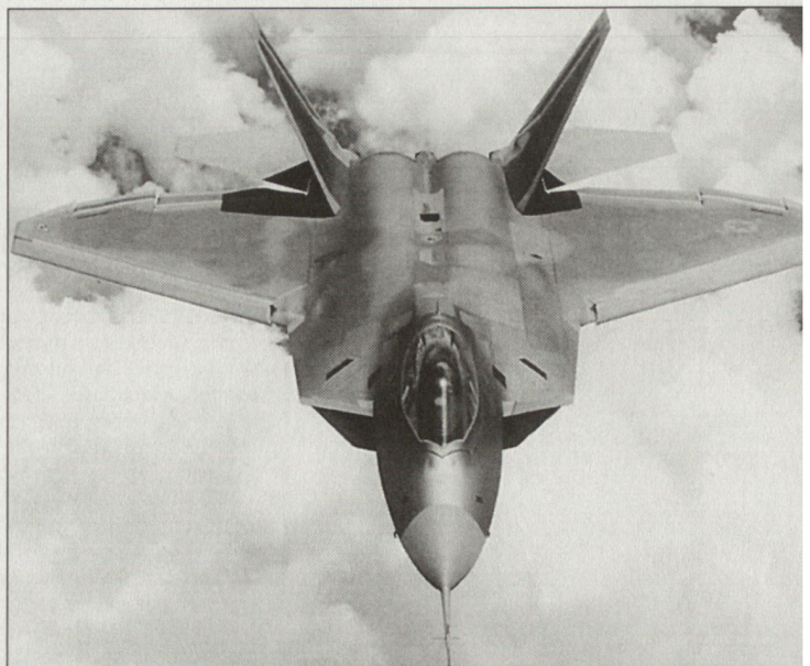
Nach erfolgreichen Flugversuchen sieht die Zukunft des neuen US-Kampfflugzeuges F-22 «Raptor» wieder besser aus.

Unterdessen wurde aus Kostengründen die Beschaffung auf 277 Maschinen reduziert. Allerdings werden von diversen Kongressabgeordneten weitere Kürzungen beim F-22-Programm gefordert. Air Force-Minister Roche hat allerdings den Sorgen der Politiker, dass die F-22 zu teuer sei, widersprochen. Gemäss seinen Aussagen sollten die Kosten fallen; denn im letzten Jahre konnte die US Air Force den Auftrag von 21 Maschinen zum Preis von 20 aushandeln. In Wirklichkeit betragen nunmehr die Kosten pro Flugzeug noch 150 Mio. US-$. Dieser Stückpreis dürfte – gemäss Minister Roche – im Verlauf des Produktionsprogramms noch weiter fallen. hg