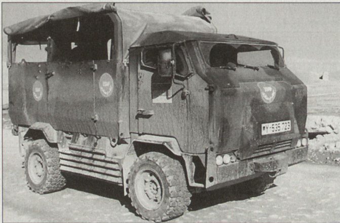
Prototyp des geschützten Geländelastwagens im Einsatz beim deutschen Kontingent in Afghanistan.

Der «Mungo» ist serienmässig mit einem flexiblen Hub- und Transportsystem versehen, mit dem das Fahrzeug sich und andere be- und entladen kann. Damit können auch Container mit Rüststätten für Pioniere und andere Truppen, Nachschubgüter aller