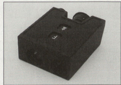
PLRF10 Pocket Laser Range Finder.

Auf Grund eines kürzlich unterzeichneten Vertrages zwischen armasuisse und Vectronix AG fertigt die Heerbruggler Firma 196 LEM 04 Laser-Entfernungsmesser für die Schweizer Armee. LEM 04 ist eine Variante des Pocket Laser Range Finders PLRF10 mit kundenspezifischer Software. Diese sowie Kompaktheit, minimales Gewicht und Erfüllung harter Umweltspezifikationen gemäss MIL-STD 810F waren entscheidende Kriterien in der Evaluation. www.vectronix.ch dk