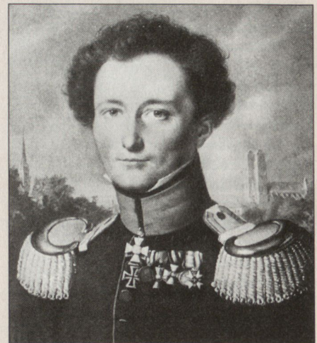
Carl von Clausewitz weilte mit Prinz August im Herbst 1807 längere Zeit auf Schloss Coppet am Genfer See (Schramm, a.a.O., S. 98).

In seinen späteren Aufzeichnungen hat er die militärische Bedeutung der Schweiz