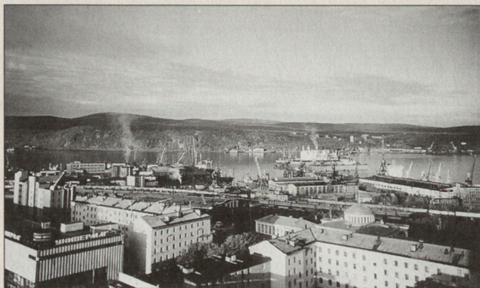
Sicht auf die Kolskij-Bucht, die Basis für nuklearangetriebene Eisbrecher. In der Mitte der helle Eisbrecher «Lenin».