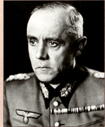
Generaloberst Ludwig Beck (1880–1944), Generalstabschef des deutschen Heeres 1935–1938. Bekannt durch seine Beteiligung am Widerstand gegen Hitler. Er verkörperte bedingungslos militärische Tugenden. Insbesondere prägte er Generationen von Generalstabsoffizieren in der Klarheit des Denkens, der Sprache und des aufopfernden Arbeitens. Von ihm stammt der Ausspruch: Wer klare Begriffe hat, kann führen. AM Bild: Buchheit Gert, Ludwig Beck, ein preussischer General, München 1964, Vorsatzblatt.