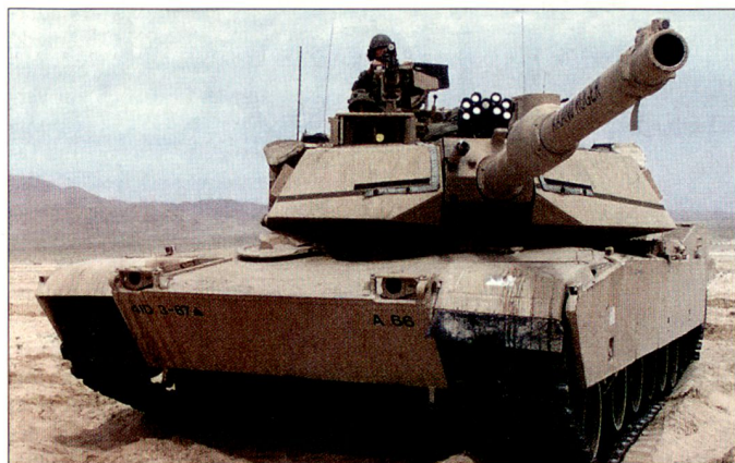
Der M1A2 «Abrams» ist der modernste Kampfpanzer der US Army.

Nach einem bisher erkennbaren, schergewichtigen Einsatz der ISAF im Raume Kabul wird nun eine stufenweise Ausweitung des ISAF-Mandats – mit so genannten PRTs (Provincial Reconstruction Teams) – auf die Provinzen des Landes angestrebt.