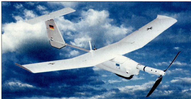
Die elektronisch angetriebene Minidrohone «Aladin» soll v.a. bei Auslandseinsätzen zum Einsatz gelangen.

Im Drohnensystem «Aladin» steckt unterdessen die Erfahrung aus über 400 Einsatzflügen, die vom deutschen Heer im Einsatz in Afghanistan und bei anderen Missionen mit Vorseriensystemen vorgenommen wurden. Die Erprobung und Testflüge erfolgten zum Teil unter widrigen Wetterverhältnissen und in schwierigem resp. völlig fremden Gelände. «Aladin» ist die kosteneffiziente Lösung für eine rasche und flexible Luftaufklärung im Nächstbereich und dient bei künftigen Auslandseinsätzen in Krisenregionen v. a. zur Gewährleistung der «force protection». hg