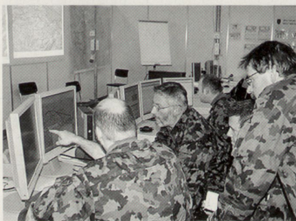
Analyse von Fakten und Nachrichten – nach wie vor eine der Hauptaufgaben der Stabsoffiziere.

Der Aktionsführungsprozess basiert in wesentlichem Umfang auf visualisierter Information und automatisierten Alarmen, welche im Tactical Operation Centre (TOC) als Entscheidungsgrundlagen verfügbar sein müssen. Für die erfolgreiche zeitgerechte Informationsführung innerhalb des TOC ist es entscheidend, dass Sensorinformationen respektive verdichtete Informationen aus den Führungsgrundgebieten (FGG) in der richtigen Qualität dem TOC verfügbar gemacht werden.