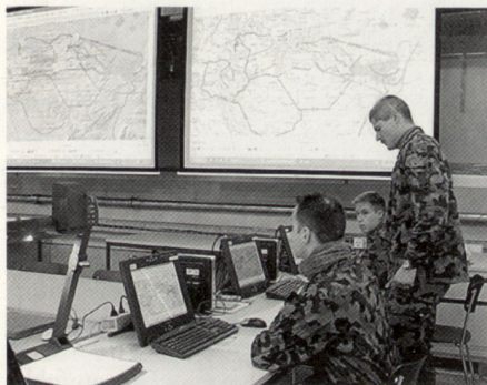
Das Bild des traditionellen KP hat sich in den letzten Jahren erheblich verändert. Computer dominieren, erübrigen aber nicht das Gespräch.

realisiert werden (Layer-, Filterdefinition), sollte aber auch bei der Interpretation von Sensorinformationen möglich sein. Abweichungen von geplanten Abläufen oder Erreichen von Bestandes- und Zeitlimiten werden vom System selbstständig erkannt und dem Nutzer in Form von Alarmmeldungen zur Verfügung gestellt. Durch die Fähigkeit des FIS zur vertikalen Informationsverbreitung müssen solche Meldungen bis auf die Stufe der Einsatzgruppe/Fahrzeug verfügbar gemacht werden.