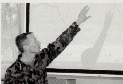
Kommunikation – unerlässliche Tätigkeit von Kommandant und Stabsangehörigen. (links Kdt Geb Inf Br 10)

Im Bereich des Aktionsplanungsprozesses muss hervorgehoben werden, dass in erster Linie Grundlageninformationen erforderlich sind, aufgrund derer die Entscheidungskriterien für die Entschlussfassung entwickelt werden können. Diese Grundinformationen müssen jedoch in regelmässigen Abständen der Ist-Situation angepasst werden, damit auch Folgeplanungen auf der korrekten Ausgangslage basieren. Die à-jour-Haltung der Grund-